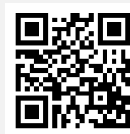
メール申込用 二次元コード